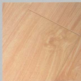
38009 roble natur