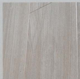
8719 roble blanco