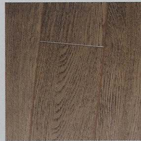
38004 roble envejecido