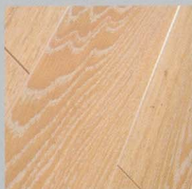
3111T roble decapado